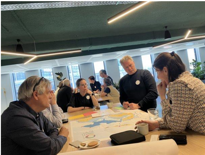
Gezamenlijk ideeën ontwikkelen.