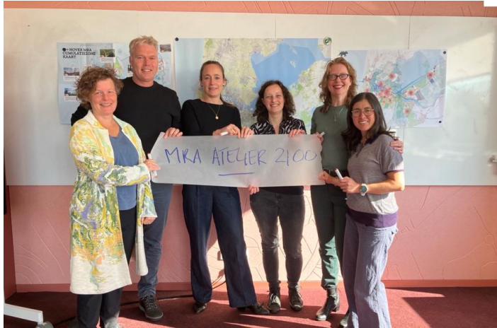
Het huidige kernteam atelier MRA 2100

De samenstelling is wisselend: De gemeente Amsterdam leidt het atelier maximaal twee jaar. Daarna neemt een andere MRA-partner deze rol over.