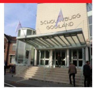
Theater Gooiland Hilversum