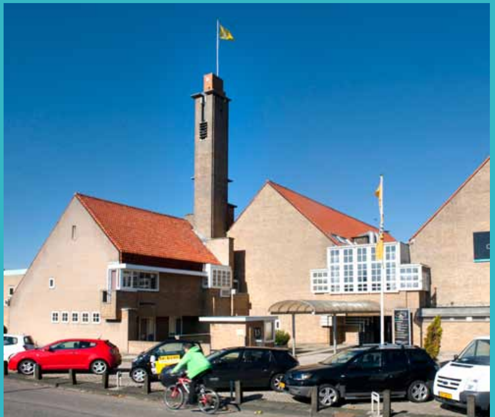
Nieuwe gebruiker gezocht voor voormalige studio's Endemol