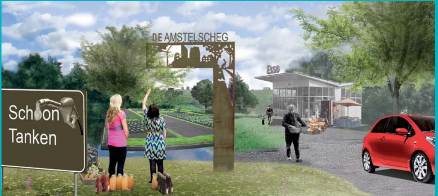
Impressie van een mogelijk snelwegknooppunt op de Amstelscheg op de kaart te zetten

Onlangs is het startschot gegeven voor het uitvoeringsprogramma 'Mooi Amstelland'. Dit betekent dat de komende jaren allerlei projecten worden uitgevoerd om de waarde van de Amstelscheg voor bewoners en bezoekers te vergroten.