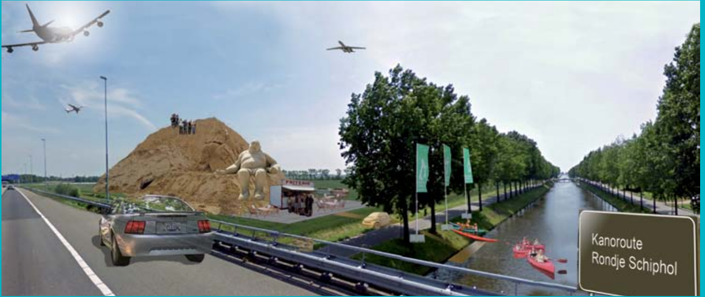
Impressie van een tijdelijk knooppunt langs de A4 nabij Schiphol