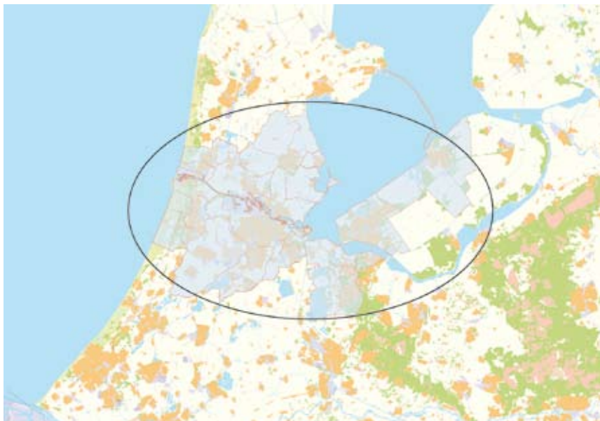
Figuur 1.1 Metropoolregio Amsterdam

Metropolen hebben over het algemeen een hoger Bruto Regionaal Product per hoofd van de bevolking en groeien economisch sneller dan het landelijk gemiddelde. Dit komt door een combinatie van schaalvoordelen, specialisatie en innovatie. Binnen Europa staat de economie van de Metropoolregio Amsterdam in de subtop, na grootstedelijke agglomeraties als Londen en Parijs. De charme van deze kleine wereldstad vormt tegelijkertijd een risico: hoe blijft de regio – in een wereld van globalisering en schaalvergroting – aantrekkelijk als vestigingsplaats voor internationale bedrijven, werkenden en bezoekers?